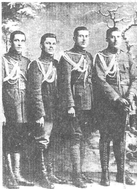
Voluntari români bucovineni