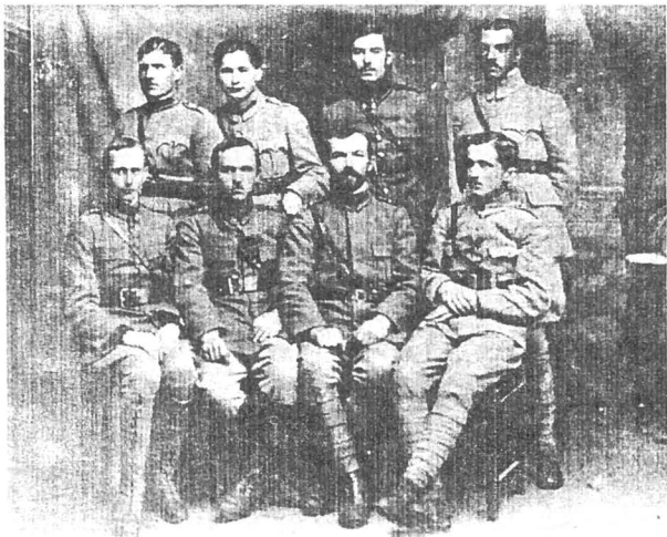
Voluntari bucovineni în Regimentul 2 „ALBA - IULIA“