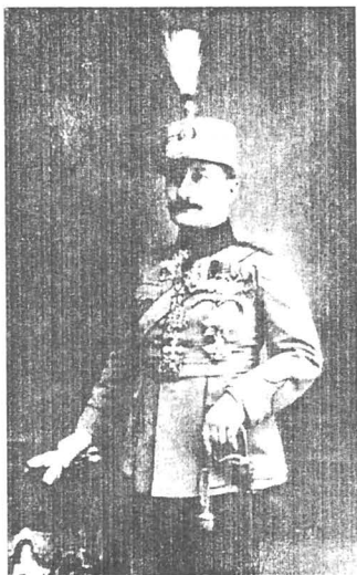
General Iacob ZADIK, comandantul Diviziei a VIII-a Regale