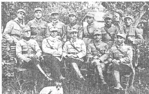
Grup de ofițeri români bucovineni