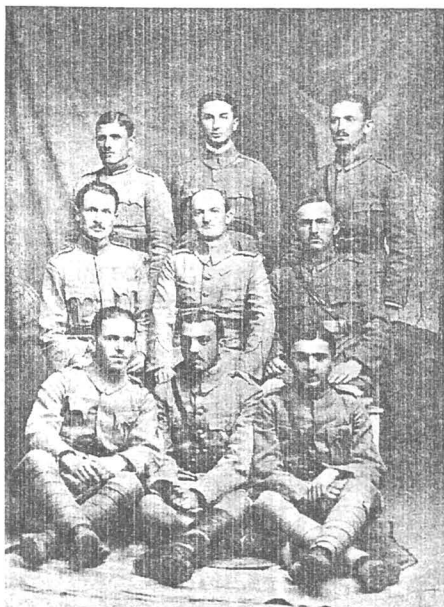
Alt grup de voluntari bucovineni din Regimentul 2 „ALBA - IULIA“