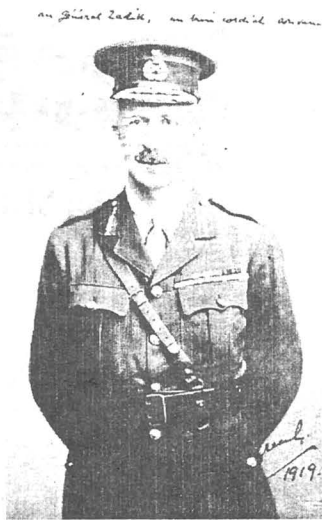
General GREENLY, șeful misiunii militare engleze