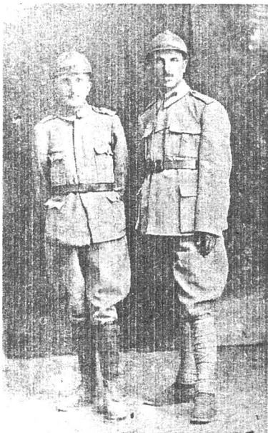
Voluntari bucovineni la Școala de ofițeri din Botoșani (februarie 1917)